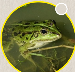
La grenouille verte