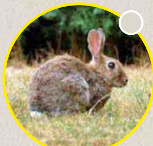
Le lapin de Garenne