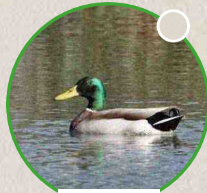
Le canard Colvert