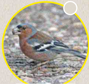
Le pinson des arbres