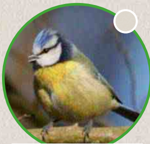
La mésange bleue