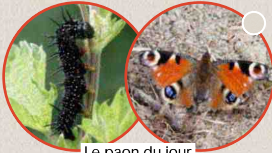
Le paon du jour