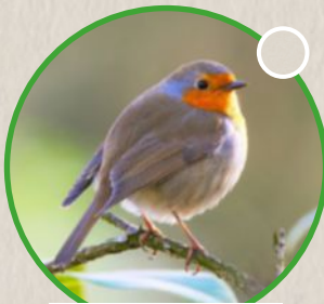
Le rougegorge familier